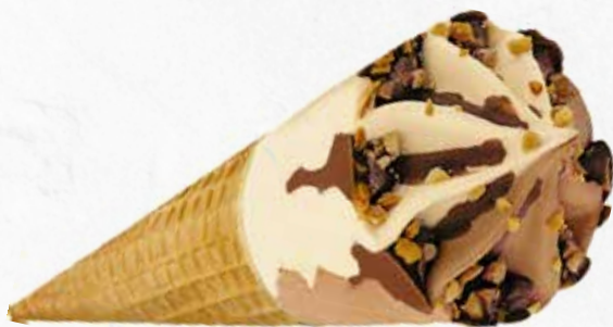
C-876 CONOS DE VAINILLA Y CHOCOLATE (125 ml)

Caja: 20 Unidades / El litro le sale a 3,92 €