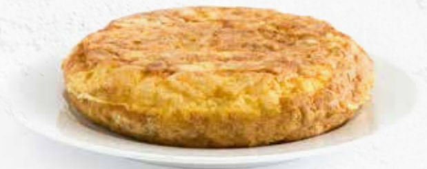
C-57 TORTILLA DE PATATA Y CEBOLLA (TORTILLÓN) Envase 1500 g Caja: 6 Unidades / El kg le sale a 3,30 €

¡Para disfrutar como tu quieras! Tiene un 30% de Bogavante y con un toque de calor, en menos de un cuarto de hora la tendrás lista. ¡Cocinar es más sencillo y sano!