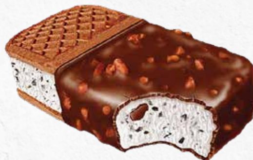
C-766 SÁNDWICH DE STRACCIATELLA (150 ml/u)

Caja: 24 Unidades / El litro le sale a 5,80 €