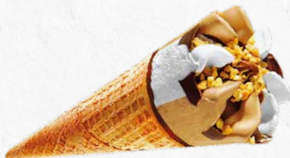
C-968 CONOS DE NATA TURRÓN (125 ml)

Caja: 20 Unidades / El litro le sale a 4,40 €