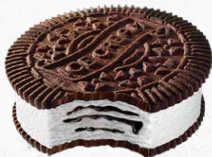
C-773 SÁNDWICH DE BLACK COOKIE (90 ml/u)

Caja: 24 Unidades / El litro le sale a 7,22 €