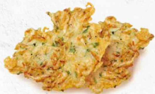
C-3402 TORTILLITAS DE CAMARÓN (PREMIUM) Caja: 2 kg La ración de 100 g le sale a 0,75 €