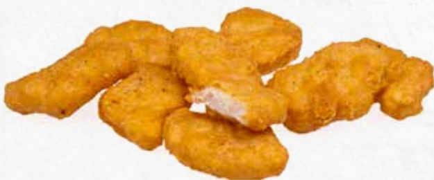
C-6308 NUGGETS DE POLLO (EXTRA) Bolsa 1 kg Caja: 5 Bolsas El nugget de 21 g aprox. le sale a 0,16 €

Nuggets de pollo fabricados con carne de pechuga 100% y un crujiente rebozado que le da una textura y sabor muy especial.