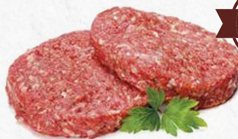
C-499 HAMBURGUESA EXTRA 100% TERNERA (150 g/u.) Caja: 24 Unidades / El kg le sale a 9,00 €

Hamburguesas elaborada al 100 % con carne de ternera, tiene un grosor mayor de lo normal, lo cual al cocinarla hace que se quede muy jugosa.