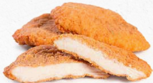
C-501 FILETES DE PECHUGA EMPANADOS Bolsa 800 g Caja: 5 Bolsas / El kg le sale a 7,48 € La ración de 100 g le sale a 0,50 €

Se trata de un filete de pechuga natural, empanada y con un leve toque de ajo y perejil. Ideal para segundo plato.