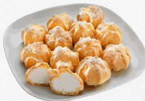
C-3705 PROFITEROLES DE NATA Bolsa 200 g

Caja: 18 Bolsas / El litro le sale a 6,00€