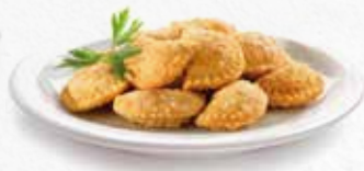
C-300 EMPANADILLAS DE ATÚN (8 U.) Bolsa 250 g Caja: 12 Bolsas / El kg le sale a 3,60 € La ración de 100 g le sale a 0,59 €