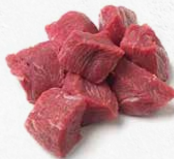
C-6398 TERNERA A TACOS PARA GUIJAR Caja: 5 kg La ración de 100 g le sale a 0,65 €

Ternera para guisar a tacos 100% natural, los dados son de 2x2 cm. aprox. Es un producto ideal para hacer en guisos con ternera.