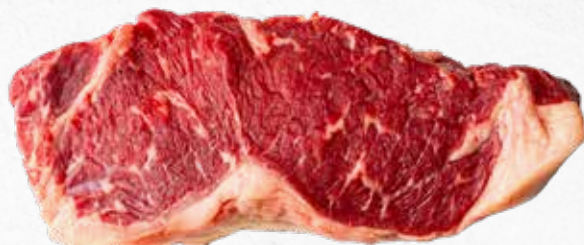
C-463 LOMO BAJO DE TERNERA (SIN HUESO) (250 g/pza. aprox.) Caja: 4,5 kg aprox. La pieza de 250 g le sale a 3,99 €

Lomo bajo de Vaca 100% natural cortado en piezas de 250 g aprox. Contiene una gran infiltración de grasa lo que le da una textura exquisita a este entrecot.