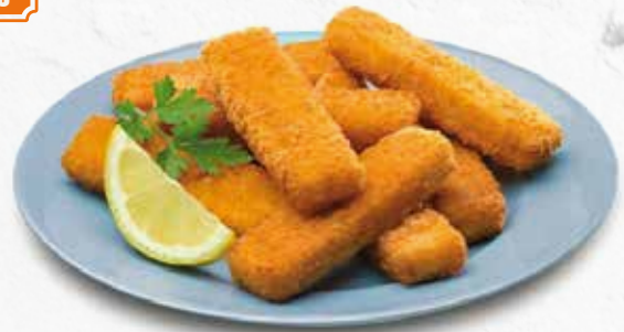
C-6152 VARITAS DE MERLUZA EMPANADAS Bolsa 1 kg Caja: 5 Bolsas La ración de 100 g le sale a 0,50 €

Apetitosas tiras de pota con un fino y apetitoso empanado, muy tiernas, listas para freír.