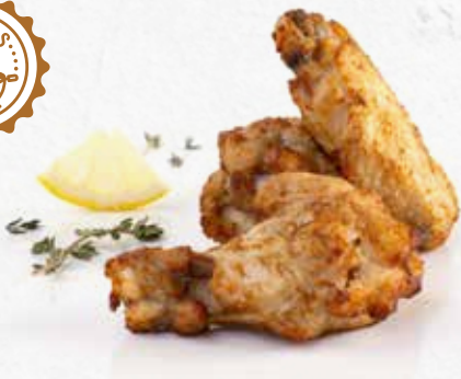
C-1080 ALITAS DE POLLO ASADAS Bolsa 1 kg Caja: 5 Bolsas La ración de 100 g le sale a 0,56 €

Alitas de pollo marinadas grill, pre-fritas y asadas con un suave toque ahumado.