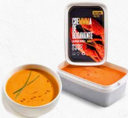
C-2673 CREMA DE BOGAVANTE Tarrina 1 kg Caja: 12 Tarrinas La ración de 100 g le sale a 0,90 €

“ Los platos preparados son una solución práctica en hostelería. Ahorran tiempo y esfuerzo, garantizando consistencia y calidad. Son ideales para ofrecer variedad y rapidez en el servicio, satisfaciendo a los clientes. ”