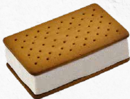
C-762 SÁNDWICH DE NATA (115 ml)

Caja: 33 Unidades / El litro le sale a 4,50 €