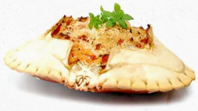
C-2674 BUEY DE MAR RELLENO (180 g) Caja: 40 Unidades / El kg le sale a 24,72 €

Relleno de buey con centollo y nécora más el auténtico sabor a mar del Fumet. ¡No necesitas ni descongelarlo ni tienes que añadirle nada! 30 minutos en el horno te separan de probar una exquisitez.