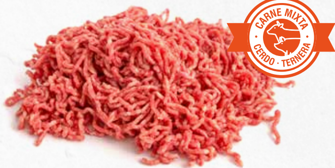
C-2212 CARNE PICADA DE TERNERA Y CERDO Bolsa 500 g Caja: 16 Bolsas / El kg le sale a 5,30 € La ración de 100 g le sale a 0,53 €

Elaborada con carne de ternera y cerdo de excelente calidad, se puede utilizar tanto como complemento para hacer lasaña, canelones, macarrones, etc.,