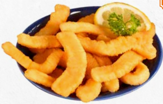
C-6488 RABAS EMPANADAS SELECTAS Bolsa 1 kg Caja: 4 Bolsas La ración de 100 g le sale a 0,760 €