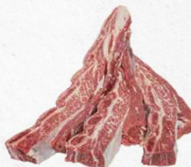
C-5555 CHURRASCO DE TERNERA Caja: 5 kg aprox. La ración de 100 g le sale a 0,76 €

Churrasco de ternera, ideal para hacer a la brasa. Carne de ternera 100%.