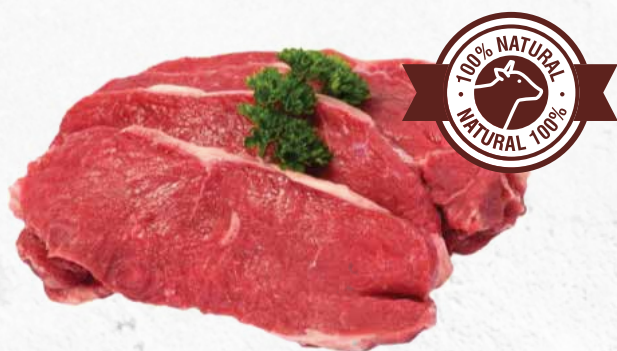
C-5560 BISTEC DE TERNERA (170 g/u.) Caja: 5 kg aprox. La ración de 170 g le sale a 1,83 €

Bistec/entrecot de ternera, exquisito a la parrilla, plancha o en una sartén, sazonar con sal gorda.